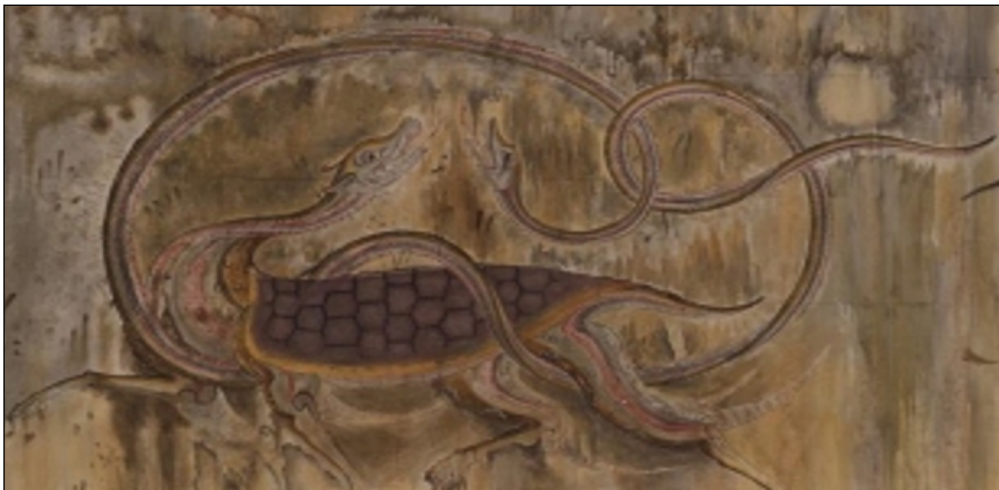
【夔龍】：靈胎、龜藏 (吉林古墓圖繪，為高句麗王朝古物)

【譯】帝堯曰：「“龍（靈、祖靈，龍神、皇天）”冒出時，“朕的臨照”就會“隨既入在基因中土上(墅)”，感受到“讒說(祖靈引出的先人舊有讒說)”，而殄行(珍惜寅時所夙殺登往的子民言行)，在腦幹孔道內的雷電震驚中聯結其師學、思承。命“汝(夔龍)”創作心律信息之納言，在“人甬殺身成仁的度智夙夜”，出納朕所臨照的旨命，惟有朕允許的才獲航載渡往！」